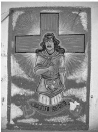
Ilustración de la imagen del Gauchito Gil

Son personajes que existieron o nacieron de leyendas populares, tal vez por acciones buenas o ser víctimas de injusticias pero sin vínculo con la Iglesia, o un vínculo que no ha sido avalado como tal. Podemos encontrar aquí nombres como: San Simón (Maximón) en Centroamérica, el Gauchito Gil en Argentina, la Santa Muerte en México o María Lionza en Venezuela. Preocupa que muchos católicos sean engañados creyendo que estos son santos católicos y hasta van inocentemente a sus santuarios.