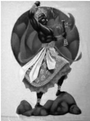
Ilustración Imagen del falso santo Shangó

En este grupo principalmente se tiene a la santería, religión africana que llegó a Brasil y Cuba proveniente de la tribu Yoruba. Estos esclavos venidos a América, mezclaron sus dioses y los “escondieron” también bajo nombres católicos. Esto es peligroso pues muchas veces inocentemente un católico puede ver una imagen de un “santo” en algún sitio y pensar que está en algo de Dios, y termina donde un brujo o algún embaucador. Los Yoruba llaman a sus dioses “orisha” y los fueron asociando a nuestros santos según su apariencia o la cualidad que se resaltaba del santo. Por ejemplo: ellos llaman a Shangó y lo asocian a imágenes de Santa Bárbara, o a Babalú con San Lázaro, o a Yemayá con la Virgen de la Regla. Esto llegó a la música salsa con Richie Ray o Celia Cruz.