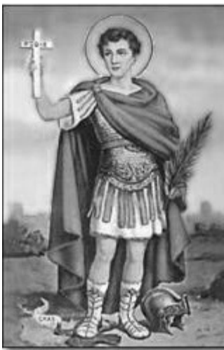
Ilustración de la imagen de San Expedito

Este grupo realmente no es de santos falsos, pero sí de cuyas vidas se han mantenido datos legendarios no comprobados. Por ejemplo: san Jorge y la lucha con el dragón es parte de leyendas, aun cuando el santo sí existió e incluso es patrono de muchos pueblos. Muchos otros santos fueron quitados por la Iglesia del Martirologio Romano pero dejando en casos el culto local como por ejemplo: San Expedito. Casos también como el de Santa Úrsula, Santa Filomena o San Cristóbal, quienes siguen siendo santos pero sin culto dentro de la liturgia universal, debido a lo difícil de comprobar los datos históricos de su