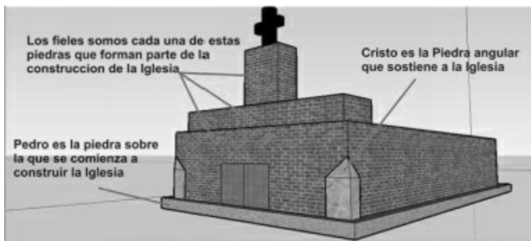
Ilustración 2 Diagrama sobre el uso de "piedra"

El texto de Mateo 16, 18 se refiere a Pedro como piedra.