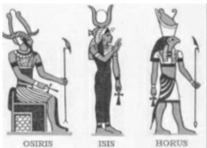
Ilustración Triada egipcia

Lo más curioso del ataque anticatólico es que no toma cuidado de la argumentación que usa y hacen referencia a una triada egipcia compuesta supuestamente por Isis – Horus – Seb. Dentro de la mitología egipcia que tiene múltiples dioses, Geb y Nut tuvieron varios hijos, entre esos Osiris (varón) e Isis (mujer). Estos se casaron y tuvieron un hijo llamado (Horus).